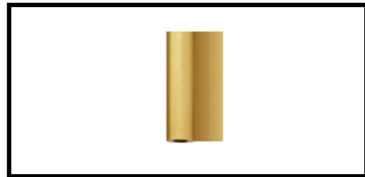
Photo du Produit :

Condt carton : 2x1 Marché : Professional (TT) Gamme : Table Top Collection : Year-round Produit personnalisé : N (N : No ; Y : Yes)