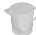
Carafe 3L graduée Réf. 07191000