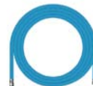
Tuyau Tuyau Ø12x19 Lg 12m50

Permet de régler la température en eau à l'arrivée de l'appareil.