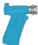
Pistolet spécial Foamfaster gainé bleu adaptation sur le cou- vercle venturi.