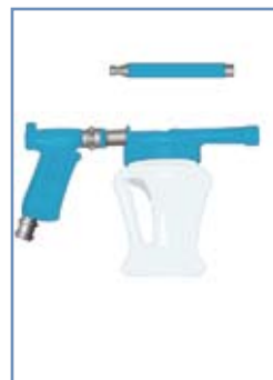
bol + lance