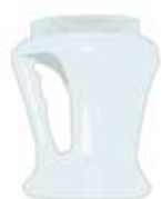
Bol en polyéthylène capacité 1L