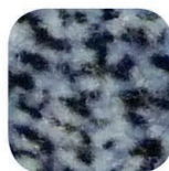
gris / bleu