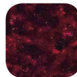
rouge / noir